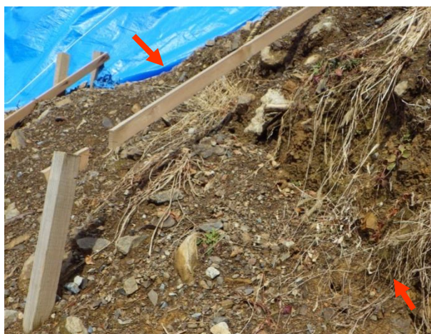
図 3-24 地表面の亀裂（抜き板による簡易的な監視例）