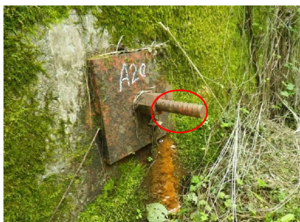
図 3-22 頭部保護がない場合のテンドンの腐食事例