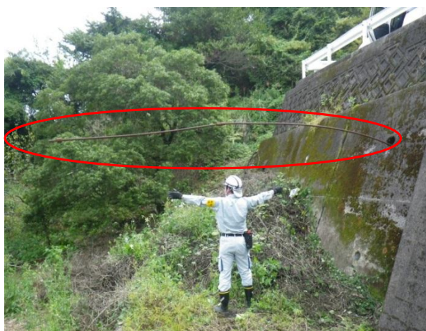
図 3-21 テンドンの飛び出し事例

アンカー工が施工位置から逸脱するテンドンの飛び出しや抜け落ちは、機能の喪失を直接的に示すものであり、常時荷重が作用するアンカー工に特有の現象である。こうした異常は危険性が高く、周辺に影響を与える可能性があるため注意が必要である。