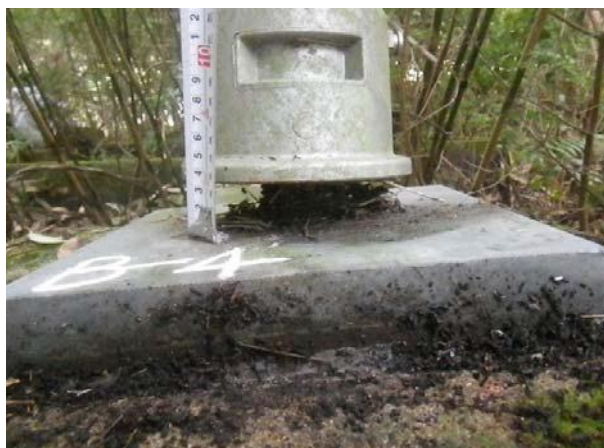
図 3-23 頭部キャップの浮き事例

ナット方式のアンカーで、頭部キャップが緩んだように見えるが、テンドンが飛び出し、キャップとナットが浮いた状態になっている。