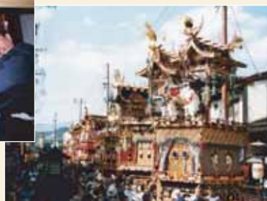
重要無形民俗文化財の例(祭礼:高山祭)