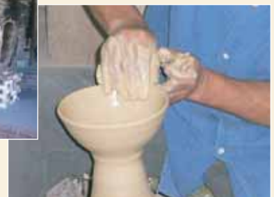
重要無形文化財の例(工芸技術:萩焼)