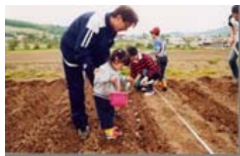
市民農園・体験農園