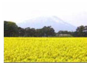
景観作物の作付け