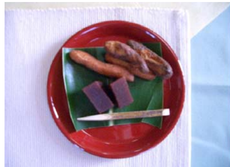
写真：農林水産大臣表彰 「もちきびかりんとう」と「ささげようかん」 あぐにぞん (沖縄県粟国村/粟国村農漁村生活研究会加工部)

http://www.maff.go.jp/nouson/seisaku/amenity/top.html