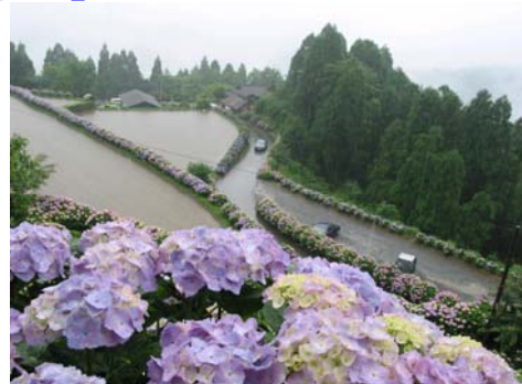
写真：農林水産大臣表彰 「花の咲いた集落「椎野あじさいロード」」 (宮崎県美郷町／美郷町椎野集落)

http://www.maff.go.jp/www/press/2007/20070215press_1.html