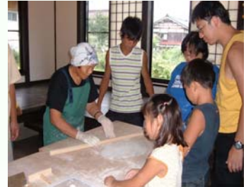
農家女性による郷土料理の伝承

全国各地に伝わる郷土料理のうち、農山漁村で脈々と受け継がれ、かつ「食べてみたい！食べさせたい！ふるさとの味」として国民的に支持されうる料理を郷土料理百選として選定します。