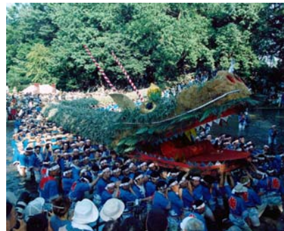
写真：第6回むらの伝統文化顕彰【農村振興局長賞】 「脚折雨乞（すねおりあまごい）」 （埼玉県鶴ヶ島市）

現在、「むらの伝統文化顕彰」の募集を行っていますので、詳しくはHP（まちむら交流機構）をご覧ください。 http://www.kouryu.or.jp/