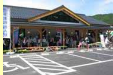
交流施設「桜ん坊」の外観