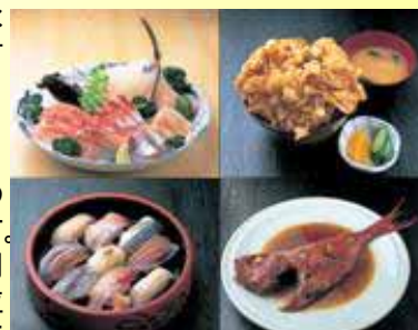
魚食普及食堂ばんやの人気メニュー

「第3ばんや」を利用した人たちからは「観光バスの利用でくるので、中々利用出来なかった。美味しく新鮮な魚が食べられて嬉しい。」や「これまで一時間位待たないと食べられなかったが予約出来ることでスムーズに食べられ、予定がたてやすくなった。」との声が聞かれました。