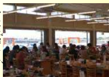
交付金で整備した「第3ばんや」

また、海洋レクリエーションの利用増加に伴い、水産業とその地域に対する理解と関心を深めるため、遊覧船の運航やプレジャーボート（ビジター）の受け入れを図る一方、日本水仙の里で知られる「江月」地区に桃やアジサイ、ツツジを植栽し、従来からの漁港という「点」から「面的」な視点で取り組みを実施しています。