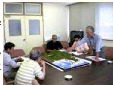
漁協活性化チームの協議の様子

そのような状況の中で農山漁村活性化法が制定され、漁港という小さな枠に囚われず、漁港と地域の活性化という視点から計画を立て、行政と事業化を目指しています。今では、漁業協同組合の中に活性化チームを作り、運営方法や収支計画などを見極める作業や行政と連携して、さらなる活性化を計画しています。