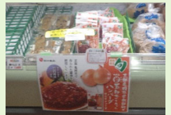
まる曾玉ねぎを使ったハンバーグ