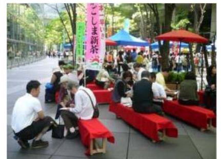
販売交流イベント出店の様子

荒茶加工施設の効率的な利用のため、品種と地形から摘採時期の早晩を組み合わせた新植を進め、これにより、品質を保ちながら、産地規模の拡大を図った。その他、生産履歴の記帳の徹底、若手後継者の積極的な販売交流イベントへの参加など地道な取り組みが産地の発展につながっている。