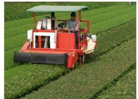
乗用型機械による茶園管理の様子

茶業振興会では、定期的に研修会や座談会を開催し、良質茶生産に向けた茶園管理や土づくりに取り組んでいる。また、茶業振興会独自の荒茶品評会を毎年開催して、より品質の高い深蒸し茶生産に努めており、一番茶の荒茶販売単価は、県内で高い水準にある。また、事業により、夏場の干ばつ時でもかん水が可能となり、茶の樹勢が向上するとともに、春先の防霜対策にも効果を発揮し、安定生産を図っている。