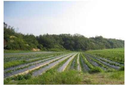
有機農業実践ほ場

有機栽培を実践しているため、以前より単収、堆肥施用等の土作りにより品質の向上に努めている。