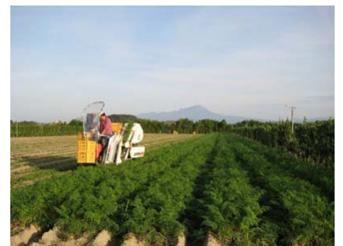
にんじんの収穫状況

また、各ほ場に設置されたスプリンクラーを活用することで、かん水時間の短縮を図っている。