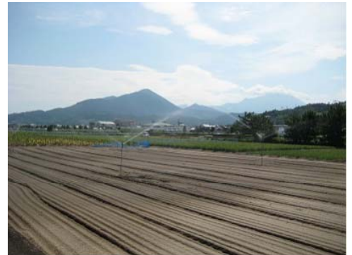
にんじんのかん水状況

以前は、水稲、葉たばこ、にんじんを主体に作付けを行っていたが、事業で造成された農地で、果樹(かき、うめ)の新植を行い、複合経営を展開している。