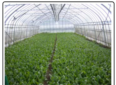
ほうれんそうの栽培状況