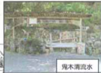
鬼木清流 ここで冷たい清流水を飲めます。