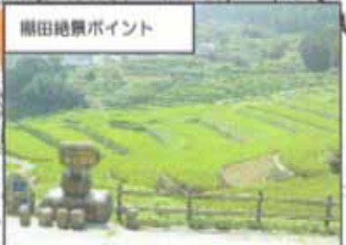
棚田絶景ポイント 鬼木棚田には約 700 枚の水田があり、災害や景観を保全しています。