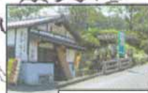
鬼木加工センター 木材の加工品が見れます。