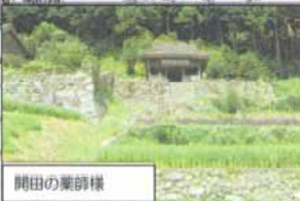
開田の薬師様 先人達の開田の苦勞を奉っています