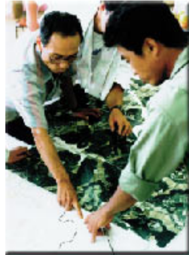
航空写真をもとに地域資源調査を補完する町役場

必要な情報の提供、資料の作成、活動資材の提供、さらに、ビジョンの実現にむけた手続きや調整という側面で、行政の果たす役割は非常に大きくなります。里地づくりに向けた住民のビジョンをくみ上げ、形にする役割です。美浜町では、地域の特性を活かした独創的、個性的活動に対し、経費の一部を助成しています。