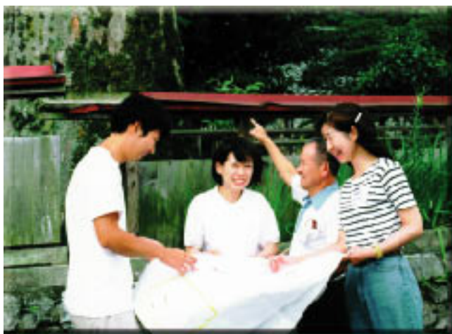
外部者の新鮮な目を借り、地元の人が地域を見つめ直す