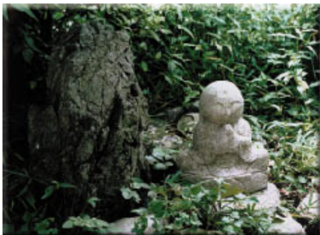
ふだん見過していた野仏や野草を地域資源調査で再発見する