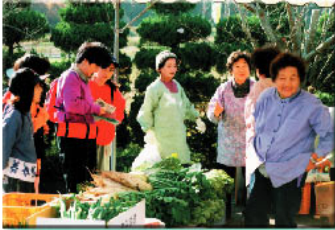
農家が田畑や山林を開放し、住民とともに野菜を作り、直販る

地域資源調査の範囲には、農家の所有地が多く含まれ、地域資源も農家との関わりがあるものが中心です。地域資源を活かした取り組みは、農家と外部者、専門家等の智恵で生まれていきます。農家の負担を減らし、作業やものの交流を地域住民や外部者、行政が担う形で進めることが大切です。