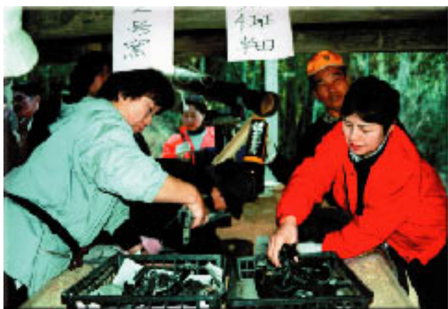
地域資源調査で見つけた竹炭窯で、竹林の再生、炭焼などの利用が始まった