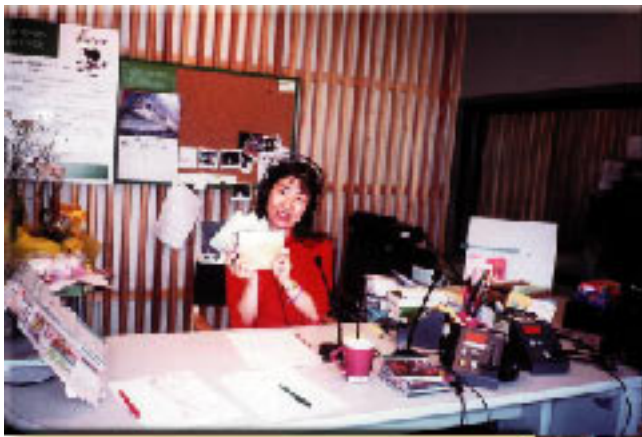
元アナウンサーを誘致し、町職員として雇用 小国 FMを立ち上げた