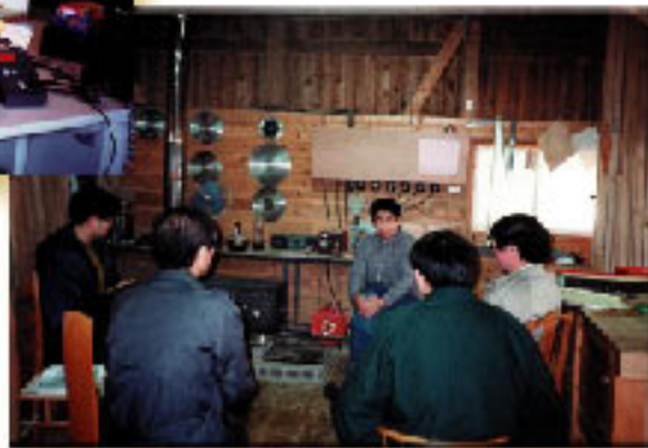
地域環境と木造建築物の景観が気に入り移住を決めた家具職人