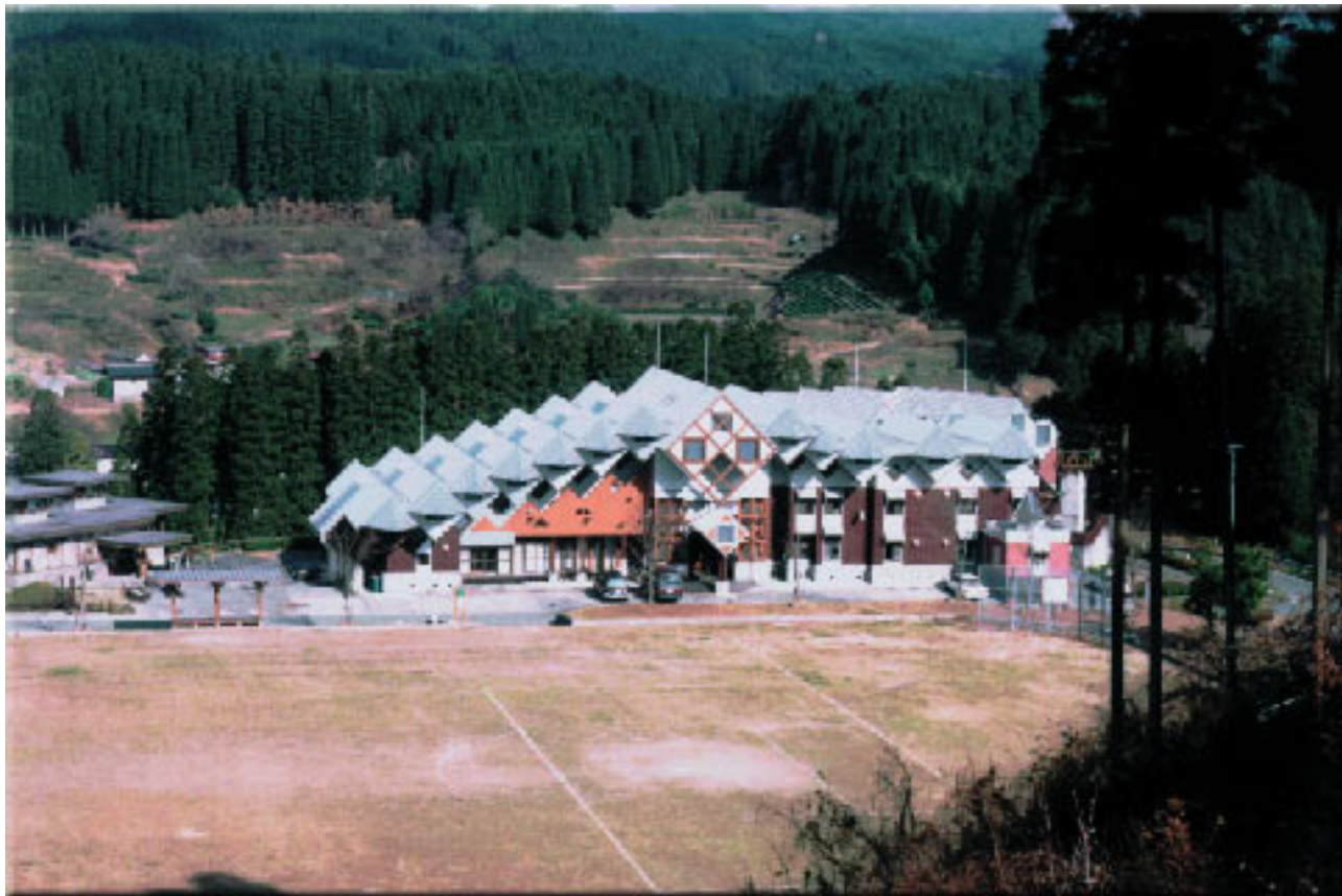
木魂館は、地元の木材を利用して建設した宿泊・交流・人材育成のための自治公民館です