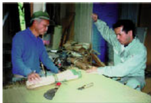
環境マイスター・無農薬栽培のイグサを伝統的技法で加工するたたみ職人

環境マイスター達のものづくりは、茶、和紙、イリコ、みかん、畳など様々です。共通しているのは、環境を汚せばそれが自分に返ってくる、環境に配慮するからといって品質は落とさない、というこだわりです。