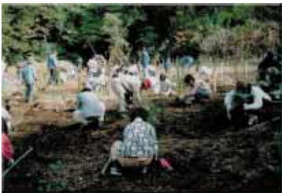
市民の森でボランティアを育成

神奈川県横浜市では、里山の土地所有者と10年以上の使用契約を結び、市民に開放することで、固定資産税を減免し、奨励金を支給する制度を設けています。里山の管理は「市民の森愛護会」を組織し、市民ボランティアを育成しつつ管理する方法を進めています。(横浜市緑政局)