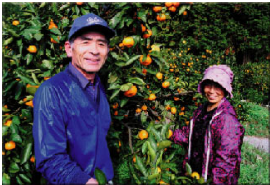
環境マイスター・無農薬のみかんづくりを行う農家

水俣市では、環境と健康に配慮したものづくりに取り組む人達に「環境マイスター」の称号を贈り、環境と健康に良い取り組みを振興しています。