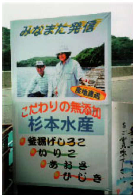
環境マイスター・無添加のイリコをつくる漁業者