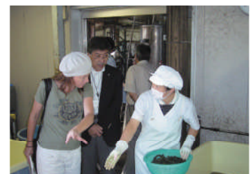
浅舞婦人漬物研究会現地調査

「様々な年代の人が同じ職場で働くことで、優れた伝統技術が無理なく後代に引き継がれていくのは素晴らしいこと」