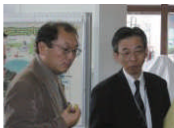
東近江市現地調査

「環境、循環、地域住民自らの活動などはマスメディアが伝えたい内容であり、素材としては最高であると思う。今後このような素晴らしい活動を広く全国へ知らしめることが大切。また、取組が成功するしないではなく、地域住民が自分たちで活動する、というプロセス自体を紹介していくことも大切なこと」