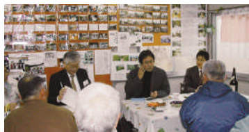
柳谷自治公民館現地調査

「自分自身、農業を応援したいと小さな活動から大きな市場を作ろうとしており、この柳谷の活動と自分の活動に通ずるものがある」