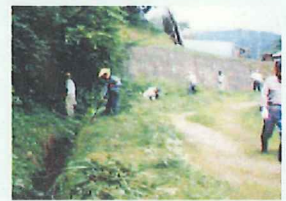
水路、道路等の管理