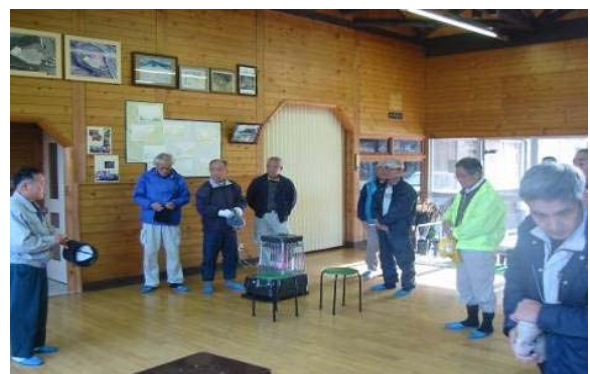
作業打合せの状況