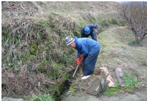
水路の泥上げの状況