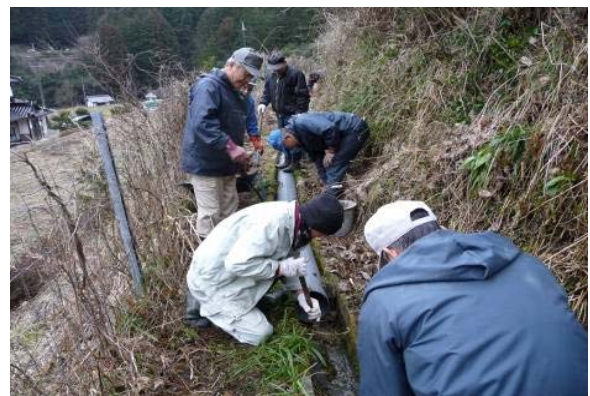
水路の簡易補修の状況