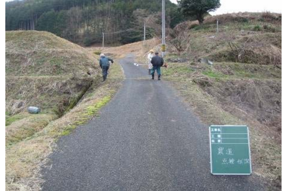
農道の点検の状況