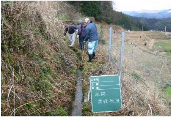
水路の点検の状況