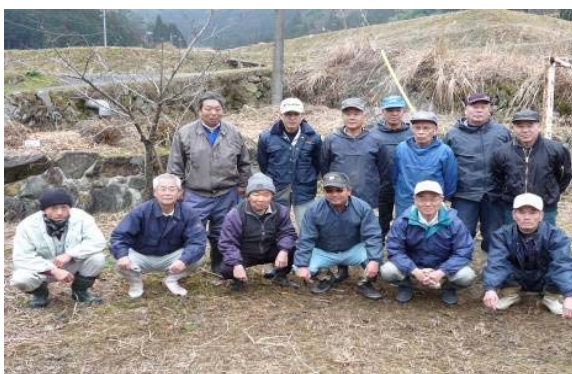
支援の方と記念写真