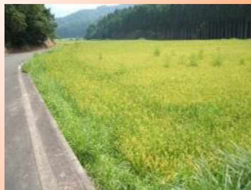
【再生作業後(水稻を作付け)】