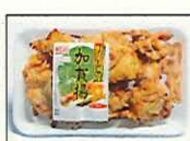
自社農園野菜使用の特性パッケージ