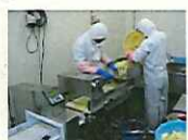
自社工場での加工