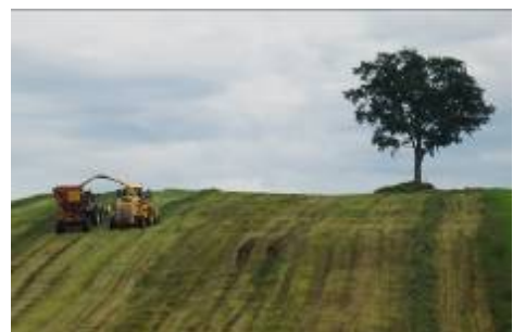
【コントラクターによる作業状況】