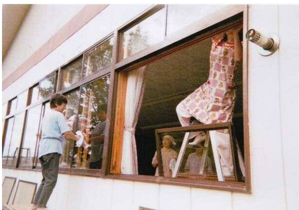
【地域の集落会館清掃活動】

また、地域の小中学校が行う農業体験事業において、集落の農業者や女性が作業指導を行うなど、農業の担い手育成および農業が有する多面的機能への理解を広める活動を行っている。