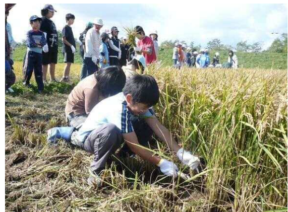
【農業体験における作業指導】