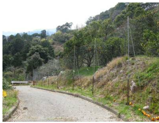
【集落内農道と獣害対策を講じた園地】