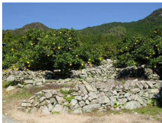
【南向きの急峻な樹園地】

また、集落共同の取組として、定期的に区域内の水路・農道の点検、維持管理作業を実施するとともに、高台の農道沿いに景観作物を作付けるなど集落景観の向上や多面的機能の保全に集落ぐるみで努めている。