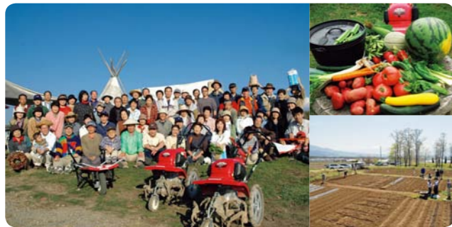
山梨県北杜市 八ヶ岳あおぞら農園

ベランダもいけど露地もね。農の扉を広く開けたい人にオススメの体験をご紹介します。