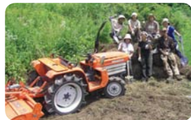
山梨県北杜市 えがおつなげて

DATA 山梨県北杜市大泉町谷戸4820。参加料1シーズン25,000円/10坪（農業指導、セット野菜4品種を含む）+入会金3,000円（初年度のみ）。http://www.net-farmers.com