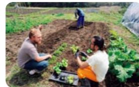
千葉県いすみ市 ブラウンスフィールド

もっと農に近づきたくなったら、近くの市民農園、あるいは別荘感覚で通える宿泊施設付き農地を借りるのはいかが？ NPOが企画する農体験プログラムもオススメ。いずれも経験豊かな指導員がいるから初級者も安心。