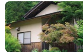
熊本県阿蘇郡 農家の宿さくらえの蛙

DATA 三重県伊賀市西湯舟3609 ☎0595-43-0909。10時〜16時30分。第2水曜休（1月〜3月11日は毎水曜休）。入園料400円。http://www.moku-moku.com