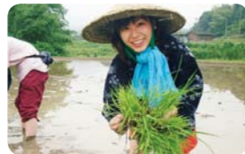
大分県宇佐市 安心院町 グリーンツーリズム研究会

DATA えがおつなげて：http://www.n-po-egao.net/ みずがきランド：山梨県北杜市須玉町小尾8842-1 ☎0551-45-0155。11時30分〜18時（6月〜9月は〜19時）。土曜・日曜・祝日のみ営業。入園料630円。