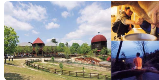
三重県伊賀市 伊賀の里 モクモク手づくりファーム

DATA 千葉県いすみ市岬町桑田1501-1 ☎0470-87-4501。宿泊料1泊2食7,500円〜。ワークショップ（http://riceterracecafe.com）も各種あり。http://www.brownsfield-jp.com