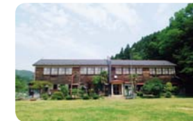
宮城県本吉郡 校舎の宿 さんさん館

稲を刈ってみたり、野菜の収穫体験をしたり……。まずは遊びながら農と地域の自然・文化に触れる旅はいかが？ 新鮮な作物がお腹いっぱい楽しめる全国のアグリパークや、農に親しむ体験ができる施設をご案内。