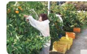
徳島県勝浦郡 ふれあいの里 さかもと

DATA 北海道札幌市東区丘珠町584-2 ☎011-787-0223。9時〜18時（10月1日〜4月28日は〜17時）。11月〜4月の月曜休（休日の場合は翌火曜休）。http://www.satoland.com