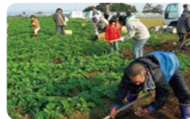
長崎県島原半島 がまだすネット

DATA 静岡県伊東市宇佐美のりの村139-1 ☎0557-85-0672。料金85,000円〜/月。別途契約保証金50,000円などが必要。http://www.saien-resort.com