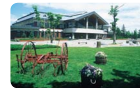
北海道札幌市 サッポロ さとらんど

DATA 茨城県下妻市長塚乙70-3 ☎0296-30-5121。第2火曜休。宿泊料1泊2食9,000円〜。体験プログラムはイチゴ狩り、ジャガイモやトマトの収穫など。http://www.beerspark.com