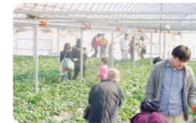
茨城県下妻市 ピアスパークしもつま

DATA 熊本県阿蘇郡南小国町大字中原中湯田4746-1 ☎0967-42-0766。宿泊料1泊2食6,000円〜。各種体験プログラム料金は問合せを。http://www.sacon-ue.sakura.ne.jp