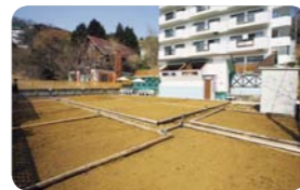
静岡県伊東市 ガーランドコート宇佐美

DATA 大分県宇佐市安心院町大字下毛802安心の里交流研修センター ☎0978-44-1158。受講料1回12,000円〜（5回分一括50,000円）、交流会費3,000円。http://www3.coara.or.jp/~ajimu