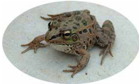
ナゴヤダルマガエル (絶滅危惧 類)