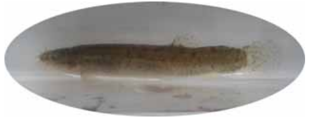
ホトケドジョウ (絶滅危惧 B類)