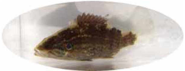
オヤニラミ (準絶滅危惧)