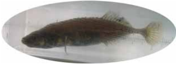
イバラトミヨ雄物型 (絶滅危惧 A類)