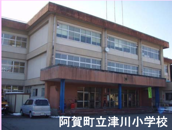
阿賀町立津川小学校