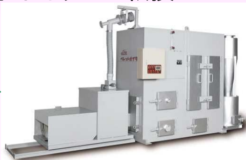
木質バイオマス焚き温水ボイラー