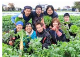
露地栽培による障害者雇用農園(茨城県つくば市)

保全すべきとされた都市農地に対し、本格的な農業振興施策が講じられるよう方針を転換