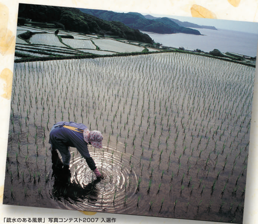
「疏水のある風景」写真コンテスト2007 入選作 「大地の恵み」鎮西町駄竹の水田 佐賀県唐津市 石原敬鎮氏(佐賀県)