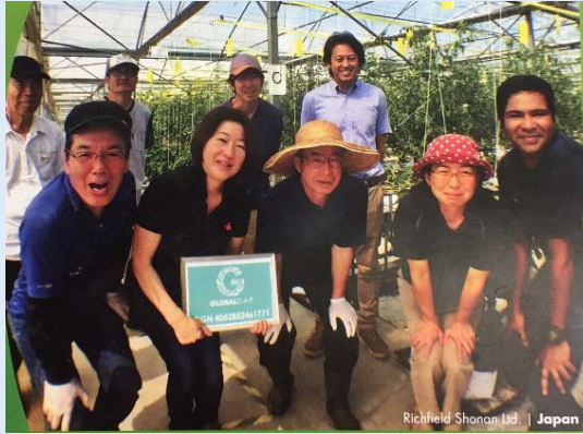
リッチフィールド株式会社