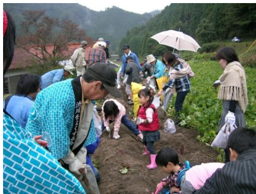
収穫祭でのサツマイモの収穫

さらに、男性陣の提案により平成 20 年に初めて開催した「収穫祭」は、マチの人や他出後継ぎなど来場者が 200 人を超える盛況であったことから、男性リーダーから、交流をマチの人を楽しませるイベントにとどまらず、ビジネスへの転換を目指すべきとの声が出るようになった。