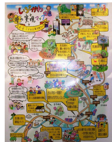
「しぶかわ夢の実現マップ」

渋川地区の現状を把握するため、会員とともに年齢構成、家族構成、後継ぎの状況等について点検した。