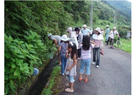
あるものさがしの様子

『地域外の人々の視点や助言を得ながら、地区の人たちが地区にある当たり前なもの（地域資源）を調査し、光を当てることで、ムラへの自信と誇りを取り戻す』という地元学の本質になり、交流参加者と地区住民と一緒に地域資源を探索する「あるものさがし」を中心に、女性や高齢者のチェヤワザ、遊休農地、休校中の小学校、河川プール、御大師様など地区の多様な資源を活かした交流となるようメニューづくりを支援した。