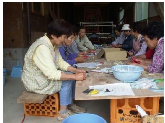
図2 らっきょうの調整作業に多数参加