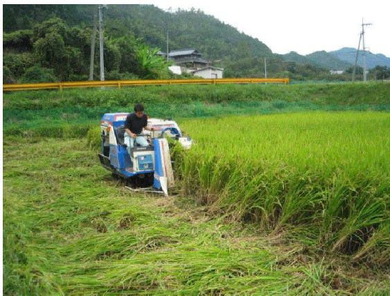
図1 飼料イネの刈り取り（畜産農家）