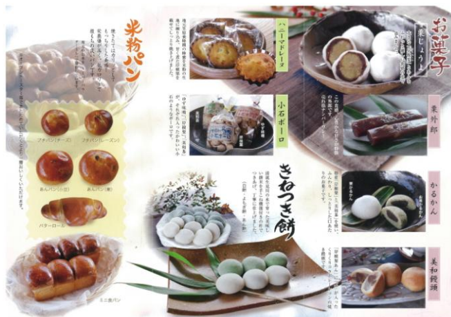
図3 菓子商品パンフレット