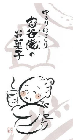
図4 法人ブランドのシンボルマーク 「ほっこりばあちゃん」