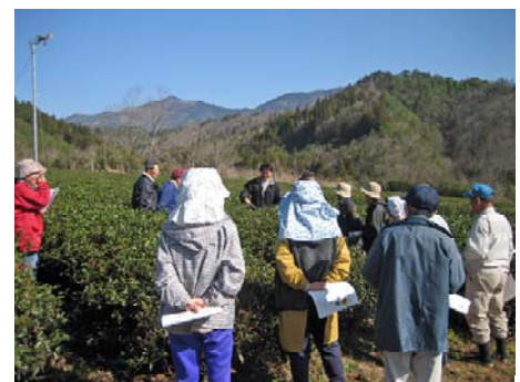
春整枝講習会の様子