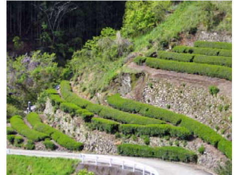
中山間地域の茶園

そこで、同町の2つの共同茶工場利用者を対象とし、中山間地域における茶生産支援体制の構築、二、三番茶の価値付与と販路開拓を図り、茶園集積と農業生産法人への誘導による持続可能な茶産地形成を目的とした。