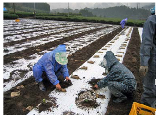
優良新品種への改植