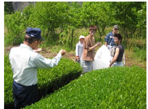
受託オペレーター講習