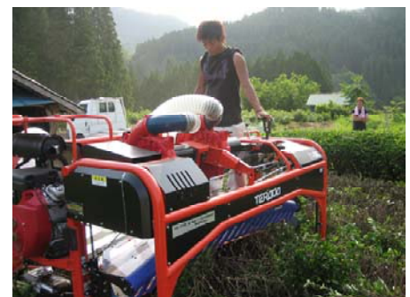
乗用型管理機による茶園更新

摘採適期通知や作業受託による生産支援、土壌診断による施肥改善など、農家のニーズに沿った活動を関係機関と一丸となって実施した結果、設立当初38名だった会員数は76名まで増加し、茶工場の利用調整（摘採日の調整）機能が強化された。