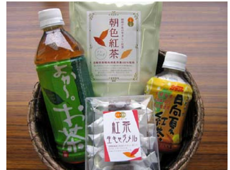
捨てられていた二、三番茶から生まれた商品達