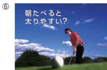
⑥ (石川プロ・オフナレ) 朝たべると 太りやすい?