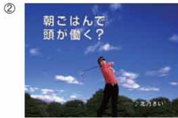
② (石川プロ・オフナレ) 朝ごはんて 頭が働く?