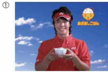
① (石川プロ) めざましごはん!