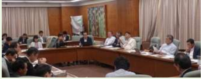
平成28年10月25日NOAFプロジェクト 「東京オリンピック・パラリンピック オーガニック・エコ食材調達戦略会議」