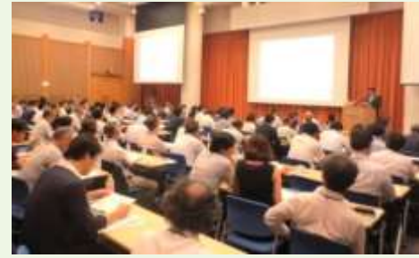
平成28年7月16日 NOAF設立記念シンポジウム