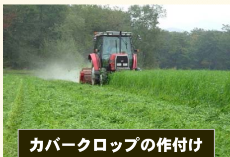
カバークロップの作付け