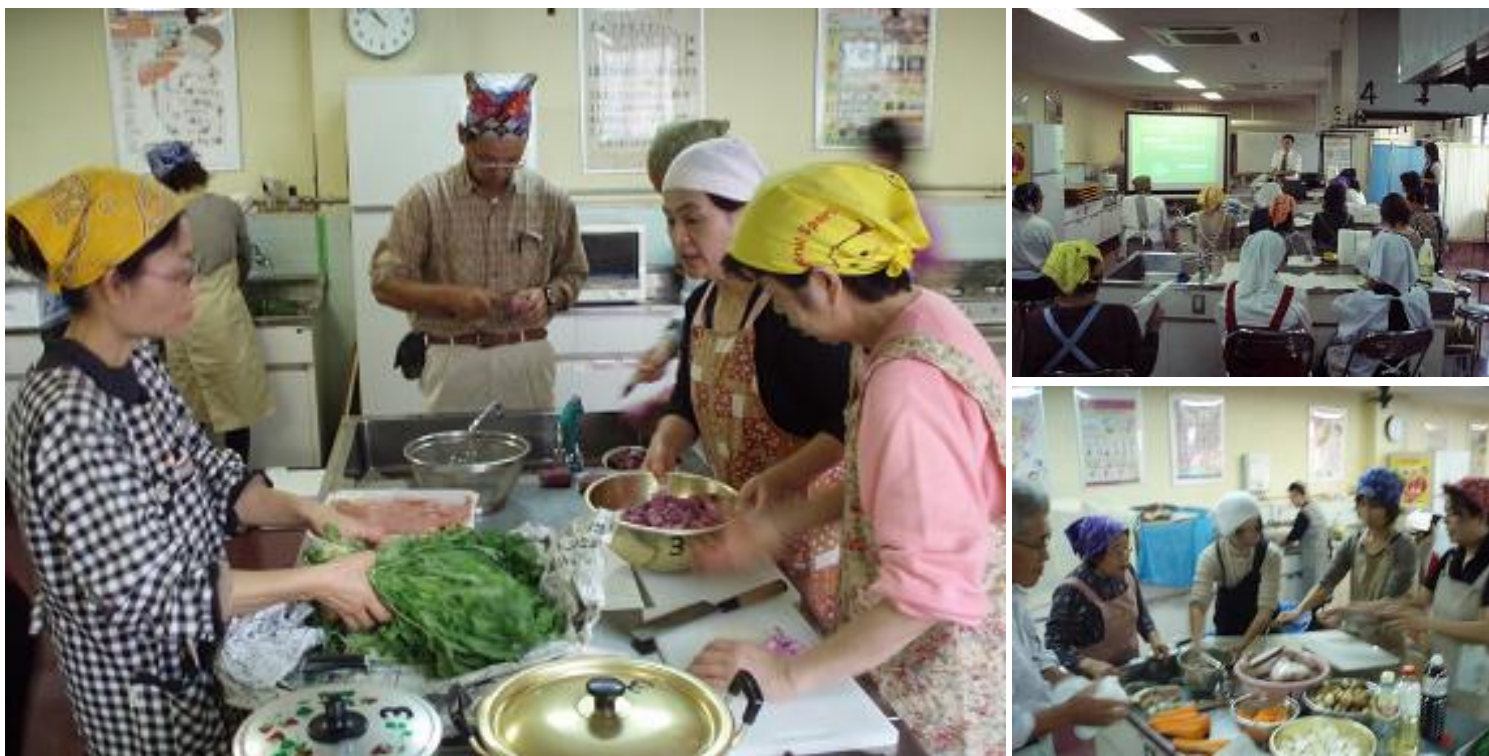
有機農産物・ブランド農産物を使用した料理教室