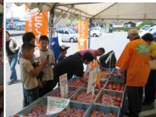
生産者による店頭販売