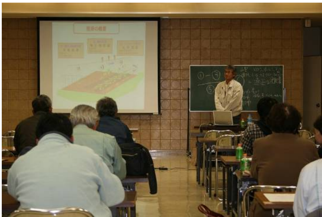
環境にやさしい生産技術・施肥技術研修会