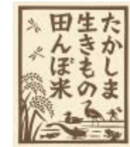
統一のロゴマークを使用した販売マーケティング活動