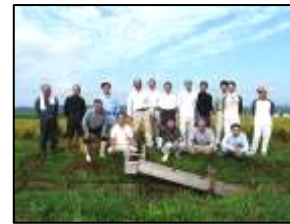
20代の若手とベテランが共に技術研鑽に励む

「生活者」「農家」「生きもの」が共に安心できる関係づくりを目指し、各種活動を実施