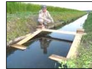
独自の魚道・スロープの開発・設置