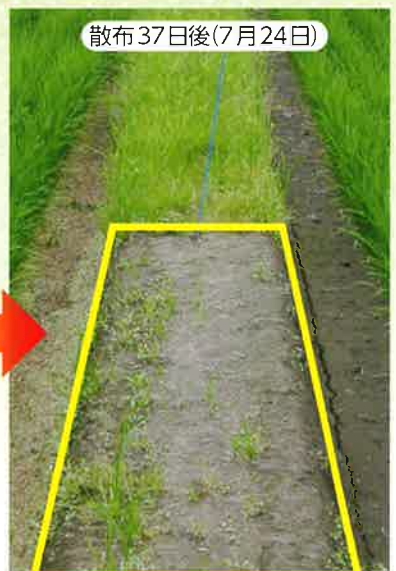
※社内試験 場所：群馬県内 散布日：2014年6月17日 薬量：300g/10a 水量：100ℓ/10a (単剤処理)