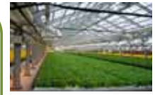
太陽光利用型植物工場