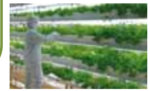
完全人工光型植物工場