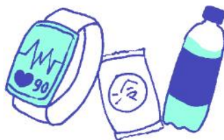
穿戴式智能设备, 急救箱