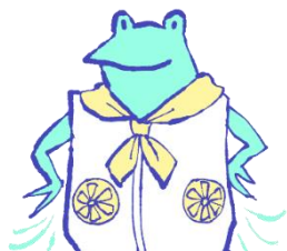
空调服, 挂脖空调冷风扇