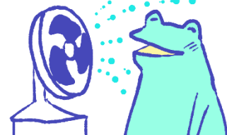
កង្ហារអំពូ

មានប្រយោជន៍ក្នុងពេលចង់ ត្រជាក់កន្លែងធ្វើការ ឬកែលម្អគុណ ភាពនៃការសម្រាក