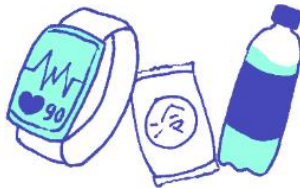
ស្ថានីយ៍ដែលអាចពាក់បាន ឧបករណ៍សង្គ្រោះបឋម

មានប្រយោជន៍ក្នុងពេលចង់ជៀសវាង ហានិភ័យនៃការធ្វើការតែម្នាក់ឯង ដោយជៀសមិនរួច