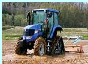
クローラー式トラクター (25馬力以上)