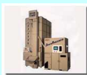
穀物遠赤外線乾燥機