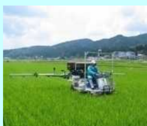
高精度肥料散布機