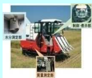
収量測定機能付き 自脱型コンバイン