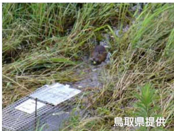
撒き餌に寄せられ、はこわなに近づいてきたヌートリア