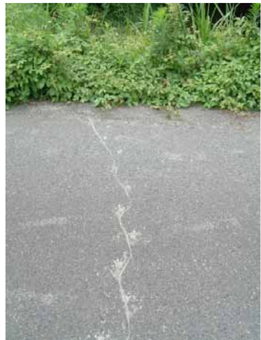
ヌートリアの歩行跡 尾を引きずった跡が残る