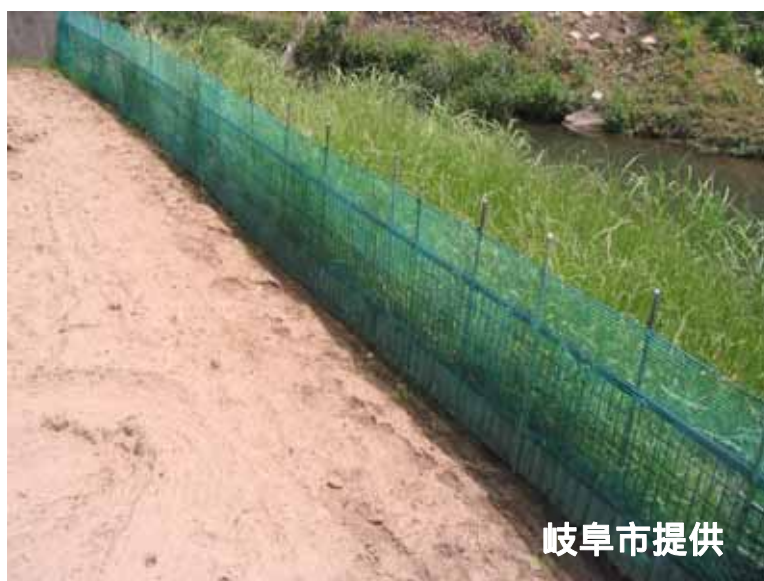
ネットと金属製メッシュ柵と波板を組み合わせた対策例