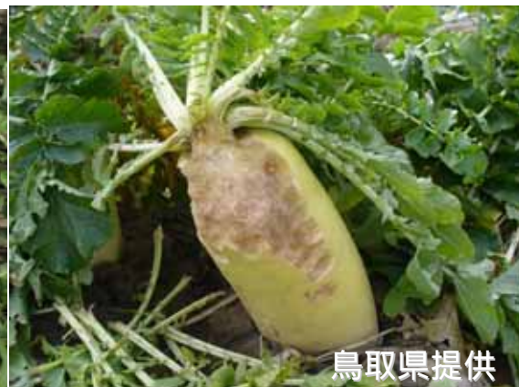
ヌートリアによるスイカ（左）とダイコン（右）の食害