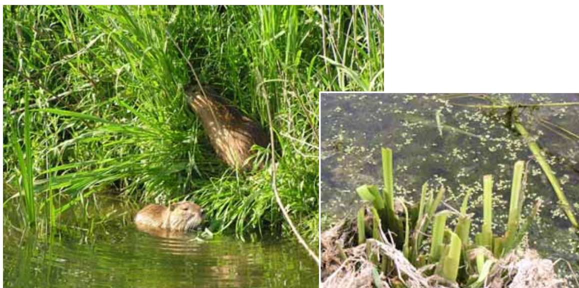
巣穴のまわりで餌をとるヌートリアと食痕

基本的に草食性で、巣穴の周辺の植物を中心に採食する。ヨシやマコモなどの水生植物の茎や根茎、ヒシの実などを特に好む。農作物では、水稻の苗をよく食べ、ニンジン、サツマイモなども食べる。二枚貝などの動物質の餌も食べることがある。