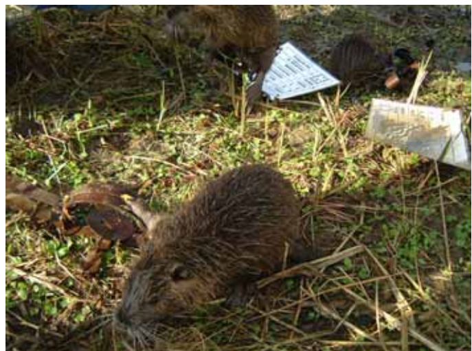
とらばさみで捕獲されたヌートリア

一部の地域では、とらばさみが使用されている。現在とらばさみは禁止猟具に指定され、狩猟での使用は禁止されている。とらばさみの使用にあたっては、有害鳥獣の捕獲等を目的に捕獲許可を得る必要がある。