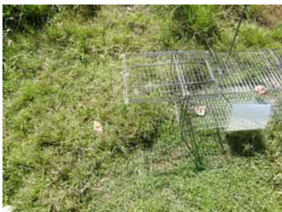
はこわなの周囲に撒き餌を置く

池などでは、水上に木材などで作った人工の筏を設置し、その上にはこわなを置く方法もある。この方法は、錯誤捕獲のおそれはあまりないが、わなの管理に手間がかかることもある。