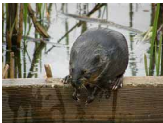
ヌートリア (左) とマスクラット (右)