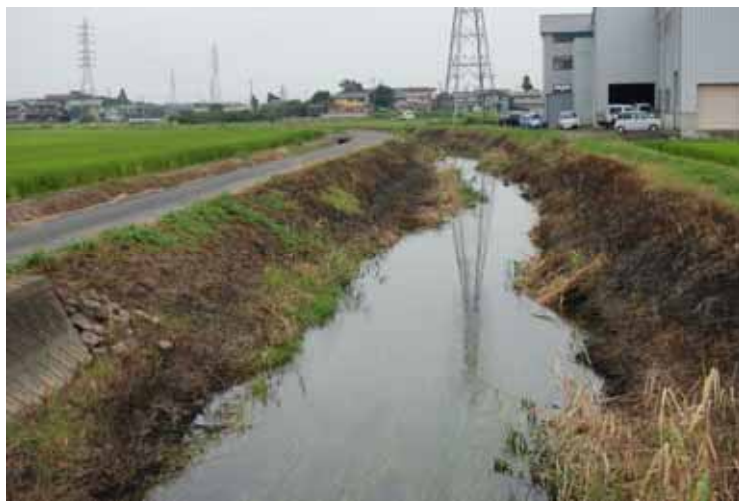
巣穴周辺を焼き払った例

田畑まわりの草の刈り払いなどにより見通しを良くする 巣穴周辺の草の刈り払い、焼き払い