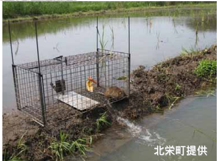
踏み板式のはこわなで 捕獲されたヌートリア