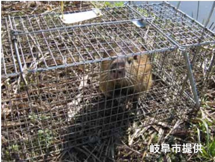
フック式のはこわなで 捕獲されたヌートリア