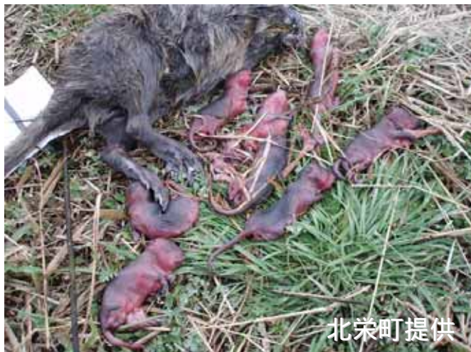
捕獲直後に出産した ヌートリア

繁殖力が強く、年に数回出産し、1回の産仔数は平均5～6頭とされる。妊娠期間は約130日である。通年繁殖するが、春に出産する個体が多い。生後半年ほどで性成熟し、繁殖が可能となる。飼育下では10年ほど生存した記録がある。