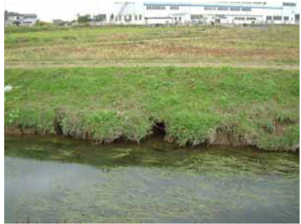
堤防に開けられたヌートリアの巣穴