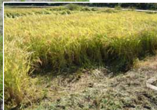
ヌートリアによる水稲の食害