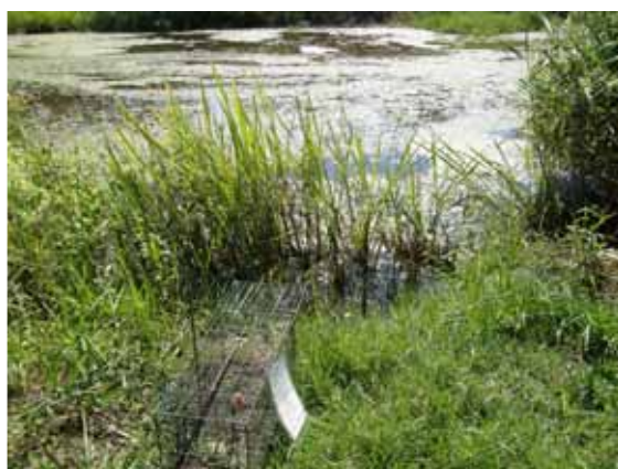
ヌートリアの利用頻度が高い場所に設置する