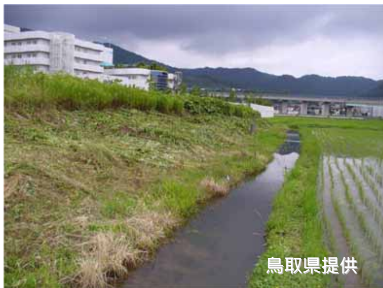
水田周辺を刈り払った例