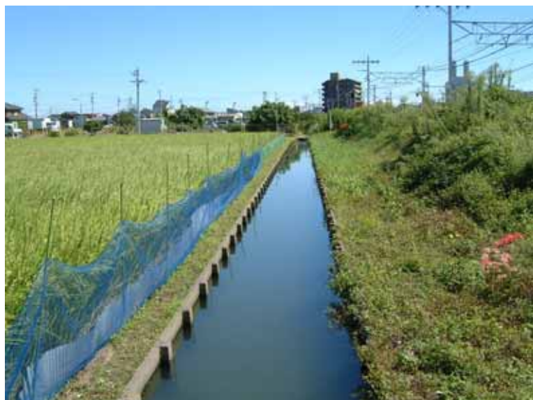
ネットと波板を併用した対策例

金網などによる侵入防止柵に電気柵を組み合わせることにより、侵入防止効果がより高くなる。