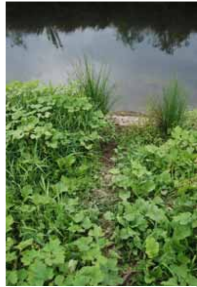
ヌートリアの けもの道