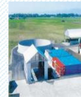
バイオガスプラント