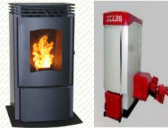
ペレットストーブ・ボイラー