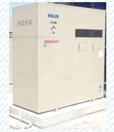
バイオガス 発電設備