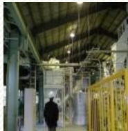
ペレット製造工場