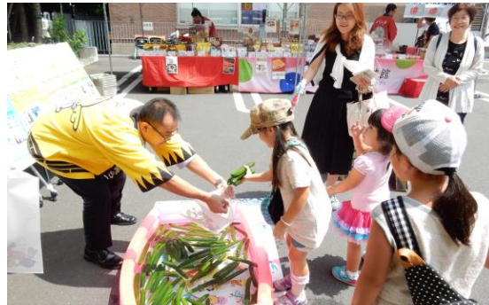
子ども霞が関見学デー「福島県産食品販売フェア」を農林水産省で開催(28年7月)

これまでの取組： 1,556件 うち被災地産食品販売フェア等： 1,231件 社内食堂等での食材利用： 221件 (23年4月～28年12月末までの間)