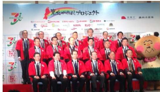
セブン&アイホールディングスによる「東北かけはしプロジェクト」(28年3月)