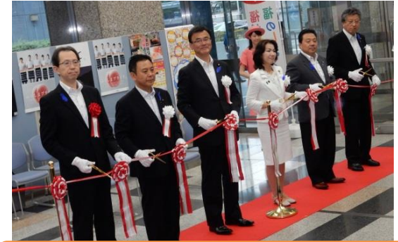
13省庁による「第2回霞が関ふくしま復興フェア」(28年7月～8月)