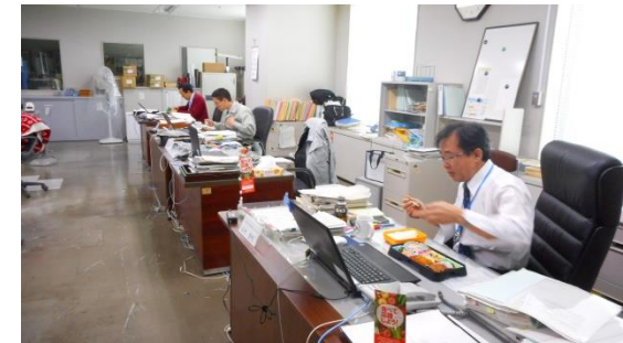
神奈川支局による被災地産食品を使用したお弁当を食べる取組(28年3月)