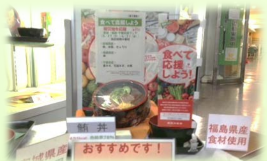
被災地産食品を使用したメニューの提供