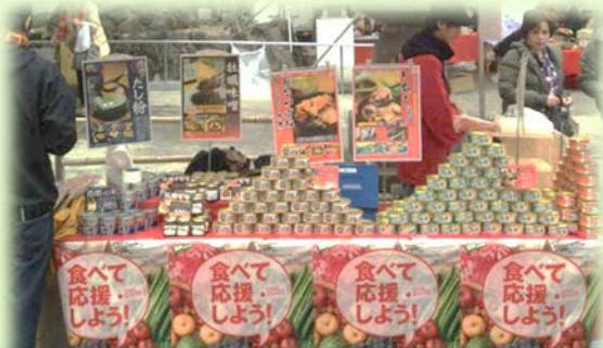
被災地産食品の販売フェア