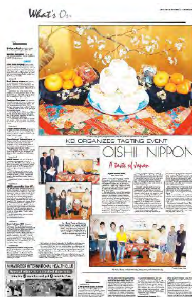
【Arab Times Oct. 29】