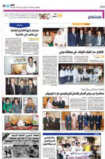
【Al Qabas Nov. 2】