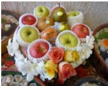
フルーツ盛り合わせ

フルーツの紹介のみならず、常設店舗紹介の機会となった。これからの反応に期待をしたい。