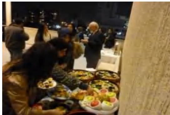
フルーツの紹介をしている様子