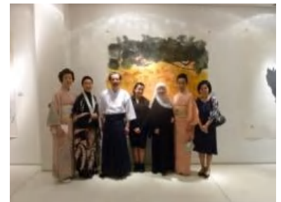
旦桂先生とお客様