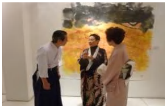
旦桂先生と、在クウェート日本大使館 小溝大使夫妻